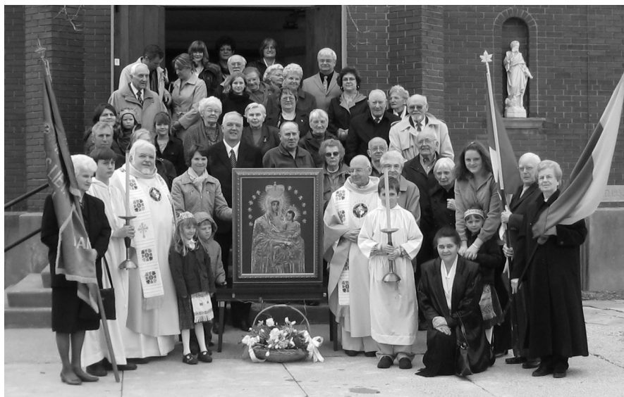
Į JUBILIEJŲ – SU PASAULIO LIETUVIAIS