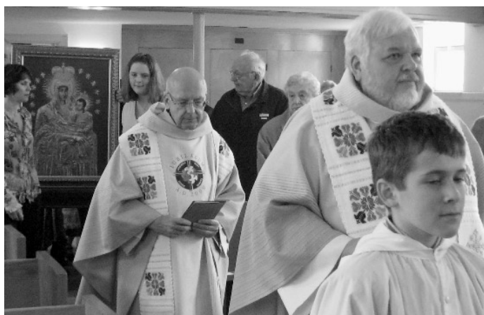
Delhi (Kanada) miestelio lietuviai sutinka Šiluvos Dievo Motinos paveikslą