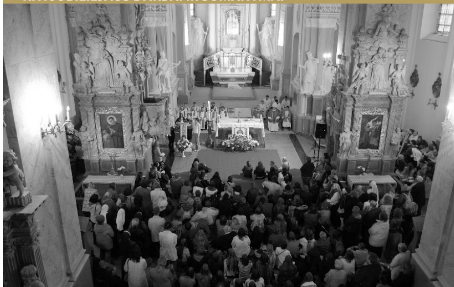
Maldos budėjimas Bazilikoje