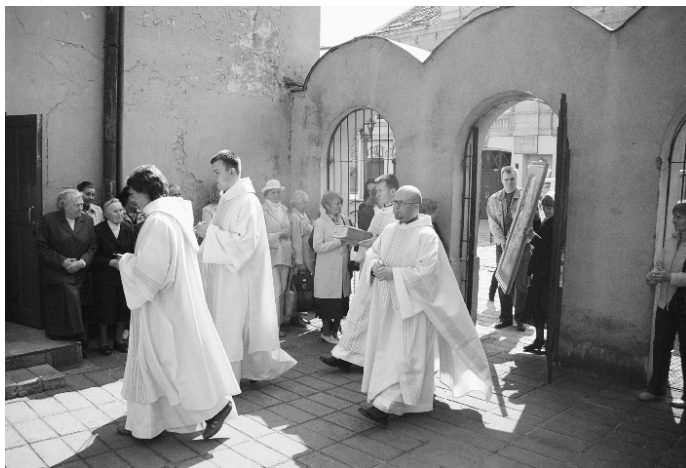
Paveikslas sutinkamas Kauno studentų koplyčioje

✱ Balandžio 6 d. Marijos paveikslas kopija pasiekė Kauną . Ji sutikta prie