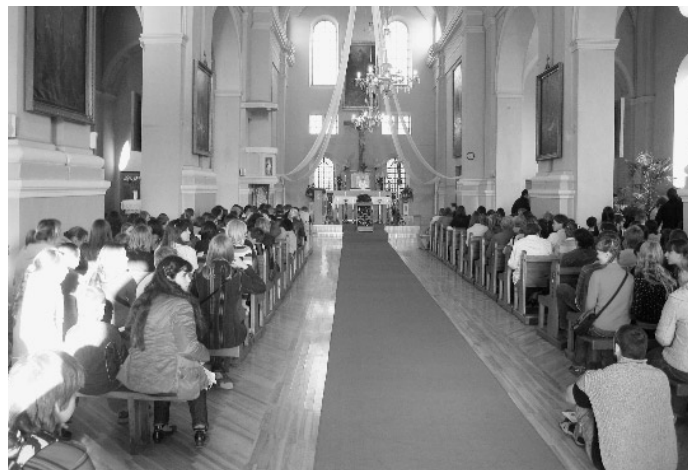
Švč. Sakramento adoracija Raudondvario bažnyčioje