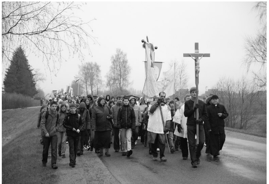
PILIGRIMINĖS KELIONĖS Į ŠILUVĄ