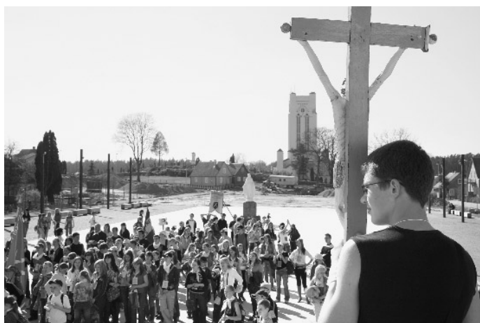
Raseinių dekanato jaunimas Šiluvoje

Sekmadienį vyko iškilmingiausia kongreso dalis – Eucharistijos procesija miesto gatvėmis. Gyventojai buvo iškėlę valstybines vėliavas, languose pasidėję Dievo Motinos paveikslėlius. Daugelis prisijungė prie einančios procesijos.