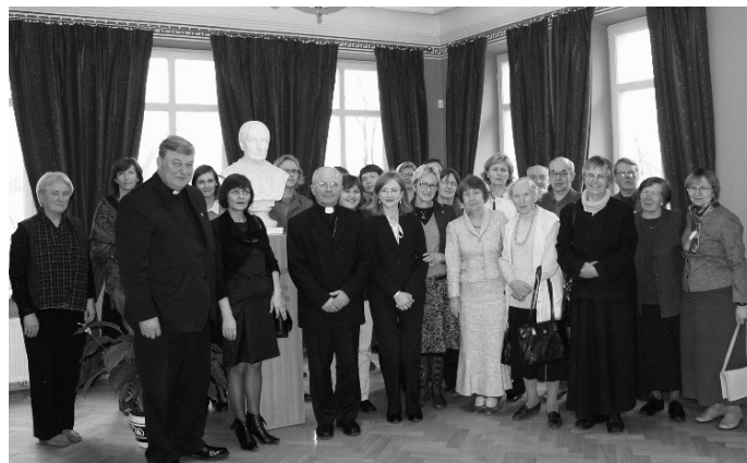
Konferencijos rengėjai ir dalyviai