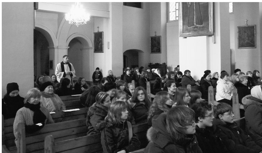
Jonavos tikintieji klausosi konferencijos