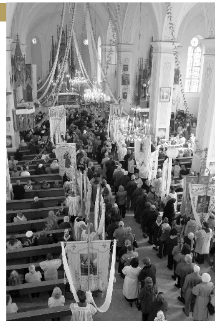
Šv. Komunija Jurbarko bažnyčioje

✝ Raseinių dekanato Eucharistiniam kongresui „Šitas mano mylimasis Sūnus“, kuris balandžio 26–27 d.