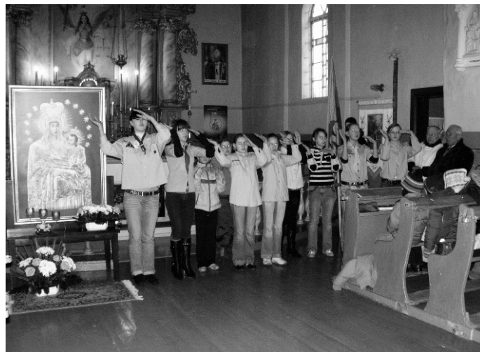
Jaunimo giesmė Upninkų bažnyčioje