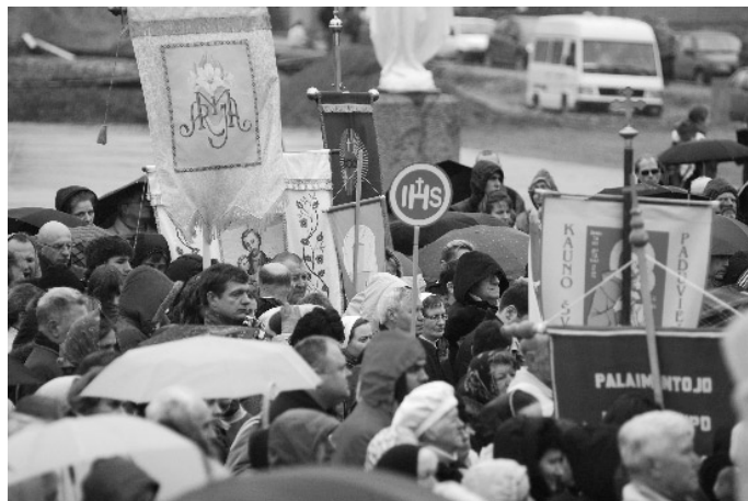
Kauno miesto piligrimai Šiluvoje