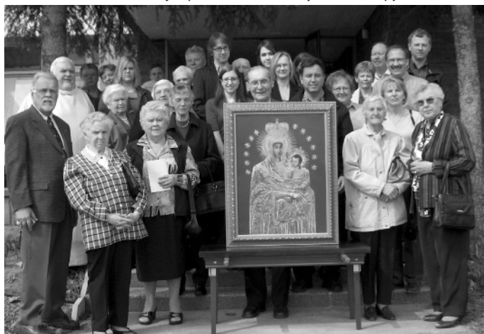
Prie Švč. M. Marijos paveikslo – Sudbury (Kanada) apylinkės lietuviai

Parengta pagal „Šiluvos žinia iševijoje“ 2008/9–12 numerius