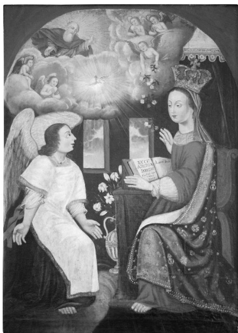
Apraiškimas Švč. M. Marijai. XVI a. II pusė. Lietuva

Parengta pagal Šiaulių vyskupijos informaciją