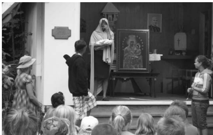
Vaidinimas Kretingos jaunimo stovykloje Vasagoje (Kanada)