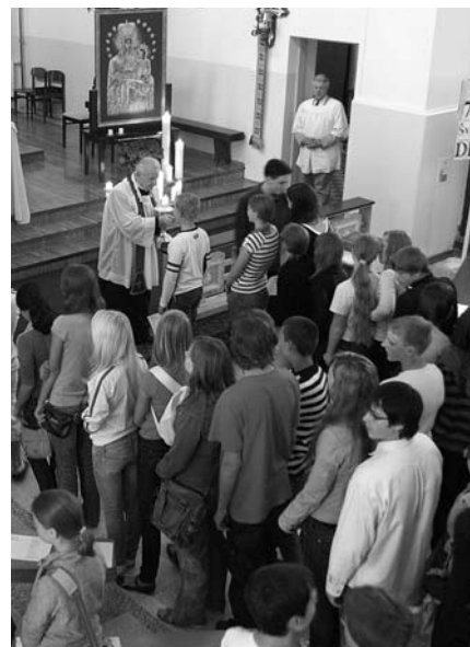
Šv. Antano parapijoje