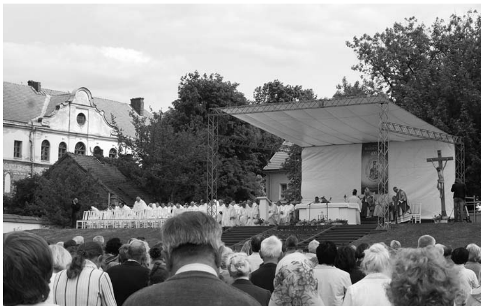
Iškilmingas Eucharistijos šventimas Jono Pauliaus II parke