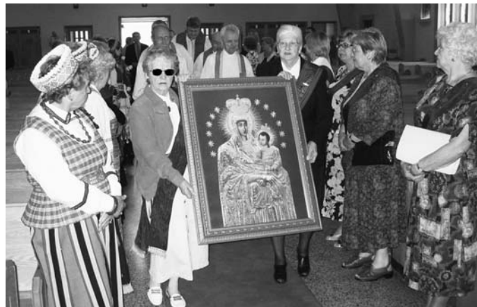
Šv. Kazimiero parapija (Monrealis) sutiko Šiluvos Dievo Motinos paveikslą