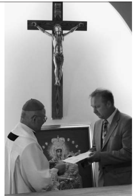
Arkivyskupas įteikia KTU rektoriumi dekretą

Koplyčios Kaune veikia Vytauto Didžiojo, Kauno medicinos, Lietuvos žemės ūkio universitetuose.