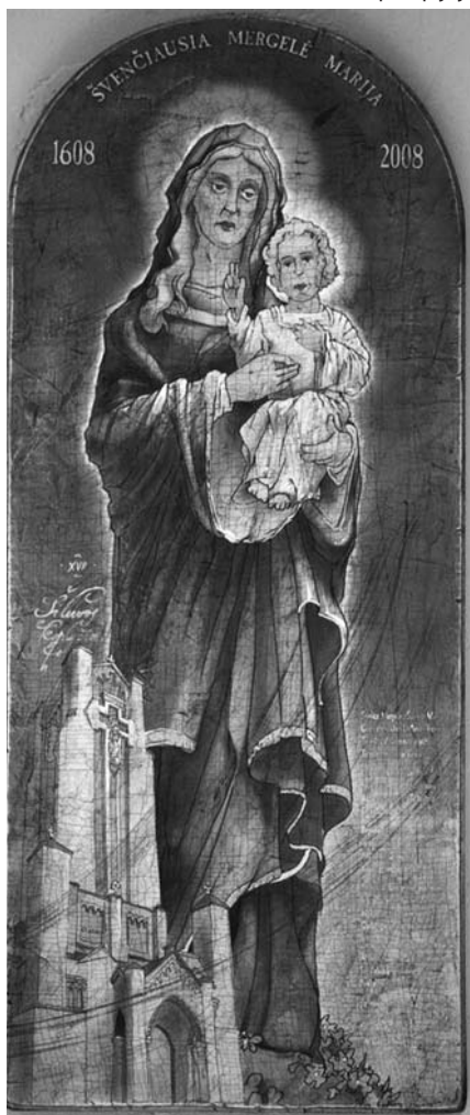
Sigito Šniro paveikslas parodoje Los Andželo Šv. Kazimiero parapijoje

Ses. Pranciška Bubelytė FDCJ Užsienio lietuvių sielovados referentė