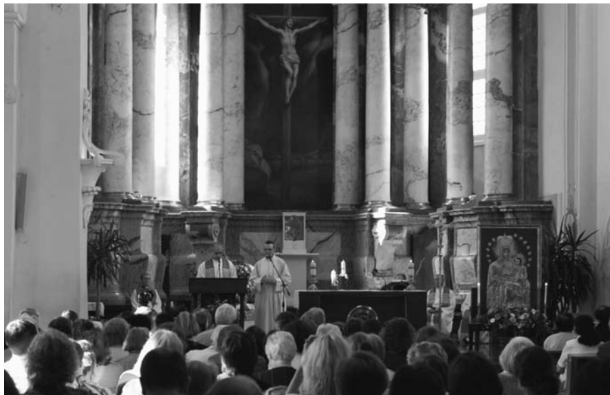
Jėzuitų generolo pamokslas

pasakęs homiliją ir kvietęs joje krikščioniškąjį gyvenimą grįsti Eucharistija.