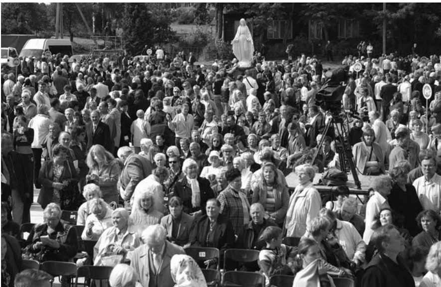
Piligrimų minia aikštėje prieš Šiluvos baziliką. 2007 m. Šilinės