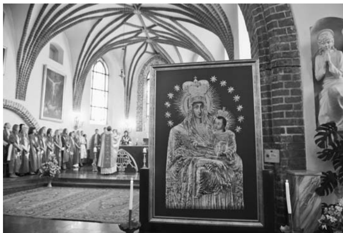
Paveikslas Švč. M. Marijos Ėmimo į dangų bažnyčioje

✳ Piligriminės paveikslo kopijos kelionės dvasinė atkarpa Švč. M. Marijos apsilankymo pas Elzbieta (Pažaislio) bažnyčioje paženklinta rugpjūčio 10–17 dienomis. Sekmadienį paveikslas seserų kazimieriečių, bažnyčios lankytojų, bendradarbių ir rėmėjų iškilmingai sutiktas Liepų alėjos pradžioje. Į maldos namus paveikslą atnešė Lietuvos kariuomenės Juozo Vitkaus inžinerijos bataliono kariai ir Šv. Kazimiero ordino nariai. Talkino ignaciškojo socialinio eksperimento