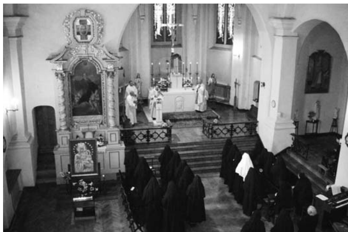
Benediktinių malda Šv. Mikalojaus bažnyčioje