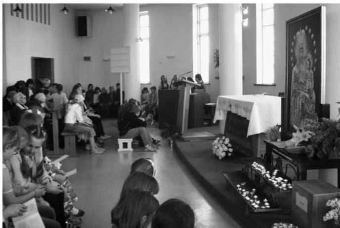
Pal. Jurgio Matulaičio parapijoje