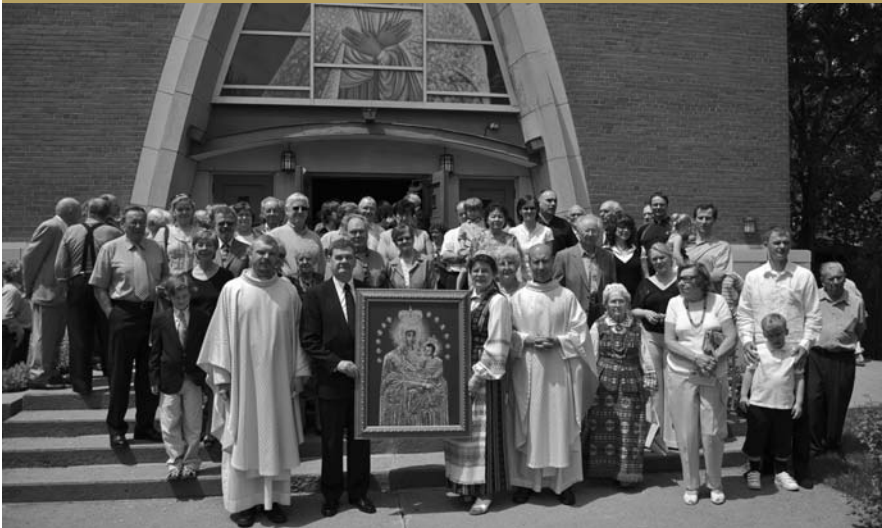
Aušros Vartų parapija Monrealyje