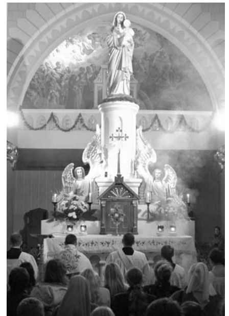
Adoracija Apsireiškimų koplyčioje

Mes priklausome nuo Dievo, kuris visiškai mums save atiduoda ir yra visiškai laisvas mūsų atžvilgiu. Juk Dievas sukūrė mus visiškai laisvai, nesavanaudiškai. Tad garbinti reiškia pripažinti, jog visiškai nuo Jo priklausome, ir atsiduoti į Jo rankas, kad Jis galėtų mums padėti būti tikrais žmonėmis, būti tuo, kuo turime būti. Garbinti reiškia dvasiškai jausti Dievo didingu-