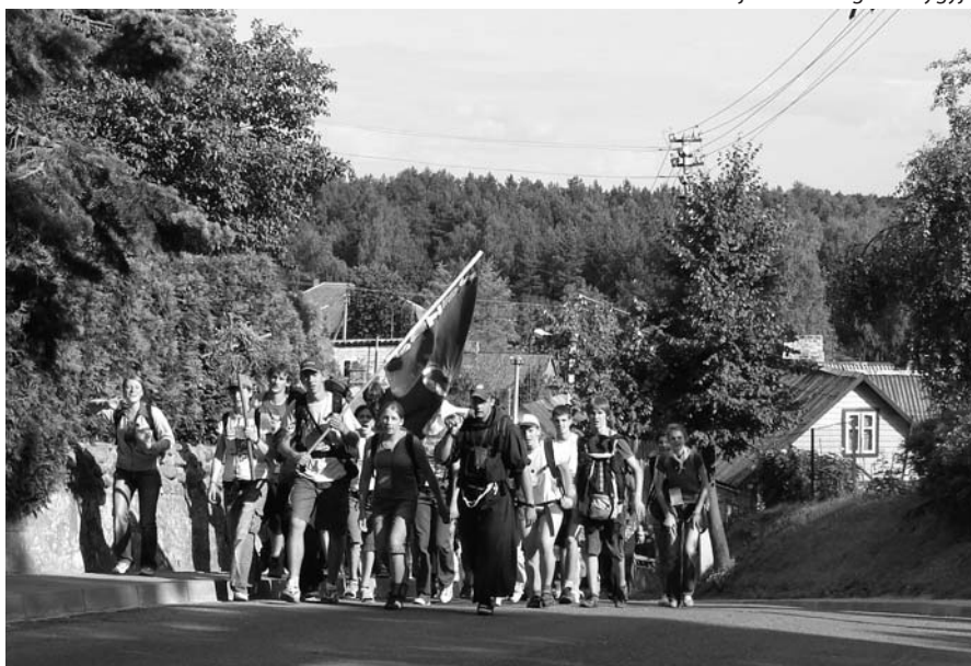
Pranciškoniškas jaunimas atgailos žygyje

Per pietus atėję į miestelį įsikuriame prie bažnyčios arba, jei jos nėra, kitoje vietoje. Dalis žygeivių meldžiasi už miestelį, jo gyventojus, kiti eina lankyti žmonių ir dėl Dievo meilės elgetauti vandens ir duonos, surinkti žmonių intencijų. Vakare atėję į miestelį kviečiame žmones į šv. Mišias, po jų – į susitikimą, kuriame šloviname, liudijame, rodome evangelizacines dramas, žaidžiame su vaikais, meldžiamės užtarimo malda. Susitikimai su vietos gyventojais tampa ir mūsų pačių evangelizacija. Kasmėt mane iš naujo nustebina žmonių atvirumas, dosnumas. Sunku patikėti, kad dar galima į savo namus įsileisti svetimą žmogų ir atiduoti jam visa, ką turi geriausio. Paprasti dalykai tampa ypatingi. Močiutės kakava ir duona su sviestu atrodo pačiu skaniausiu dalyku pasaulyje. Kasmėt per žygį vėl iš naujo patiriu, kad žmonės šias laikais yra geri.