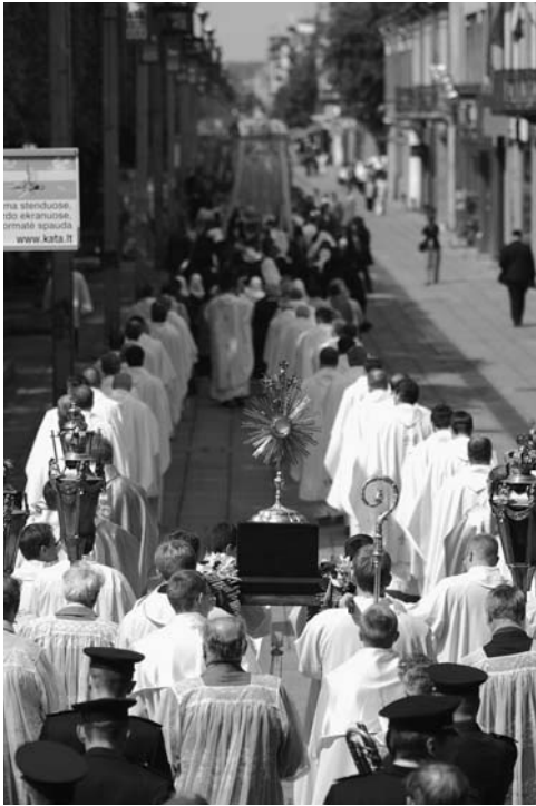
Eucharistinė procesija Laisvės alėjoje

Eucharistinį kongresą savo atvykimu, dalyvavimu, malda ir žodžiu, perdavusiu sveikinimą arkivyskupijos tikintiesiems Šventojo Tėvo Benedikto XVI vardu, pagerbė apaštališkasis nuncijus arkivyskupas Peteris Stephanas Zurbriggenas, dalyvavo dauguma arkivyskupijoje tarnaujančių dvasininkų, Kauno kunigų seminarijos klierikai, pašvęstojo gyvenimo institutų seserys, katalikiškos institucijos ir bendruomenės, visų arkivyskupijos dekanatų tikintieji. Kongresas vyko Kauno mieste, kuris tomis dienomis šventė savivaldos 600 metų sukaktį, ir tapo gražiu dvasiniu prisidėjimu prie šios šventės, daugeliui kauniečių ir miesto svečių paliudijusiu Gyvajį Dievą ir gyvą arkivyskupijos žmonių tikėjimą. Iškilmingas šv. Mišias transliavo Lietuvos televizija, galimybę drauge dalyvauti ir kitų vyskupijų tikintiesiems suteikė Marijos radijas . Sekmadienį visą dieną Kongreso proga prie arkikatedros bazilikos vyko arkivyskupijos dekanatų, parapijų, karitatyvinių, religinio švietimo, jaunimo sielovados, įvairių kitų bažnytinių institucijų prisistatymai veklą atspindinčiais standais.