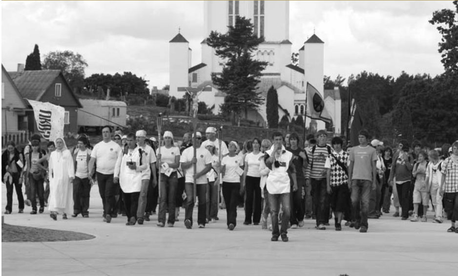
Lietuvos katalikiškų mokyklų bendruomenių piligrimai

Mišiose aikštėje priešais Šiluvos baziliką jaučiau ypatingą Švč. Mergelės artumą, jai pavedžiau visus savo rūpesčius, džiaugsmus ir prašymus. Juk Marija yra visur!!! Labai svarbu atnaujinti santykį su Ja. Kokia malonė turėti Dangiškąją Mamą, jausti jos globą, begalinę Meilę, mokytis nuolankumo, Dievo valios vykdymo. Svarbiausia – per Mariją vis labiau ir artimiau pažinti Jėzų. Namu grįžau kitokia: paliesta Švč. Motinėlis ir Kristaus meilės. Dabar negaliu sustoti, Marija laukia manęs kiekvieną akimirką.