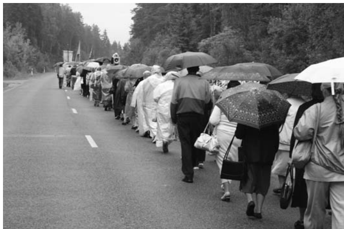
Raseinių krašto žmonės nepabūgo lietaus

daug piligrimų, daugiausia iš Ukmergės dekanato; šiai šventei jie rūpestingai rengėsi. Tarp piligrimų matome valdžios atstovus, mokyklų vadovus, moksleivius ir daug tikinčiųjų. Šis piligriminis žygis tarsi užbaigia pagrindinį pasirengimą didžiajam Šiluvos jubiliejui, nes kitas tradicinis piligrimų žygis rugpjūčio 31 d. nuo Tytuvėnų ir Dubysos jau ženklins Jubiliejaus pradžią. Tą dieną melsimės už laisvės dovaną. Gruzijos įvykių šviesoje be įrodinėjimų yra aišku, už ką mes, lietuviai,