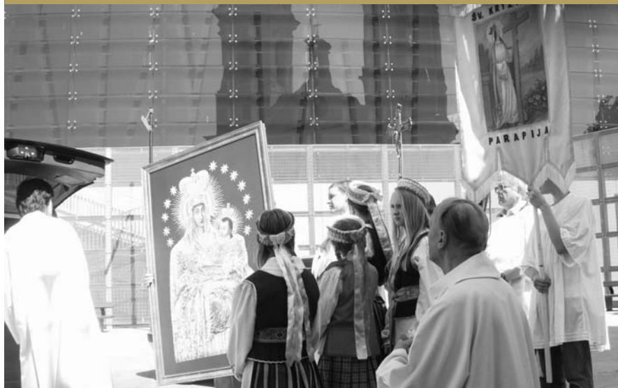
Šiluvos Dievo motinos paveikslas sutinkamas Kauno Šv. Kryžiaus parapijiečių