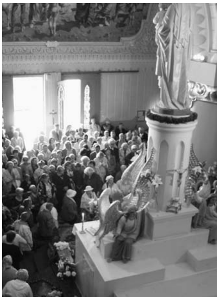
Jonavos dekanato tikintieji

kunigas akcentavo, kad mes, tikintieji, turime gyventi viltimi ir nešti Dievo siųstą žinią kitiems bei pilni pasitikėjimo ir nuolankumo priimti išbandymus. „Kiekvienas vaikelis, ateinantis į šį pasaulį, yra Dievo siųsta žinia žmonėms, kad viskas bus gerai...“ Apsilankę koplyčioje ir palikę prie Marijos kojų savo skaudulius ir bėdas piligrimai išskubėjo į Baziliką, kur vyko Švč. Sakramento adoracija ir katechezė.