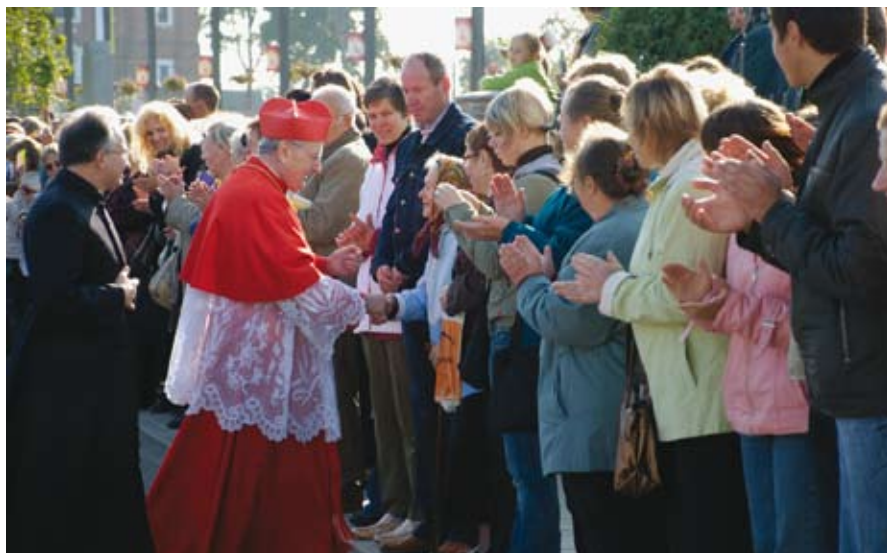
ŠILUVOS JUBILIEJUS: POPIEŽIAUS PASIUNTINIO VIEŠNAGĖ